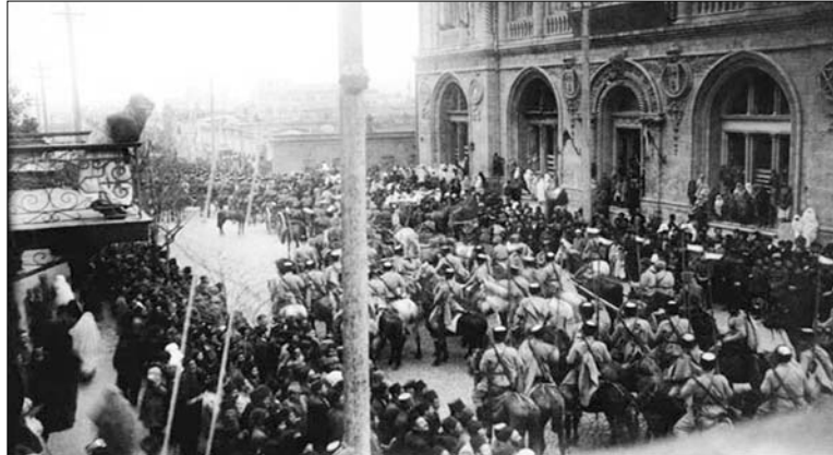
Şəkildə: Qafqaz İslam Ordusunun Bakıda fəxri keçidi.

Esmira NƏBİYEVA, ictimai elmlər və multikulturalizm kafedrasının müəllimi